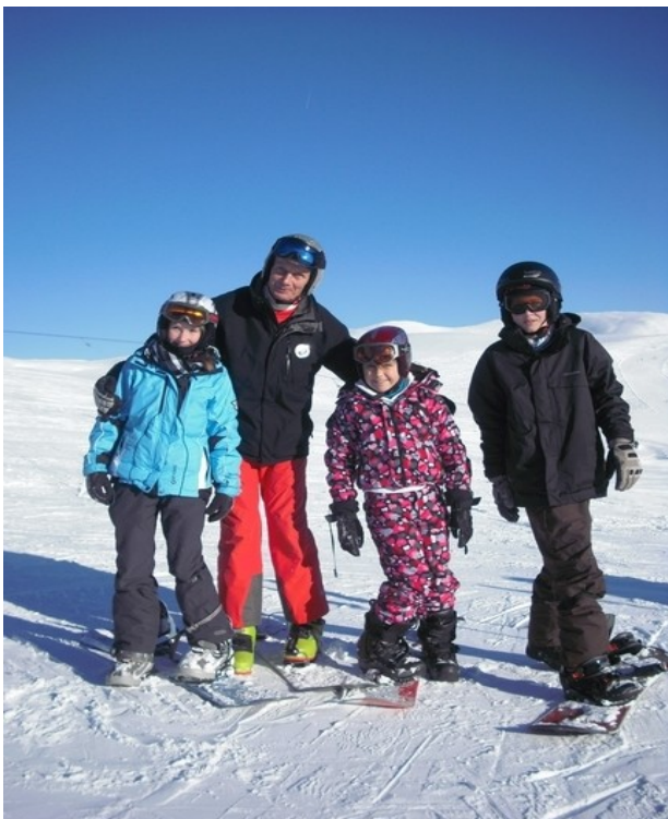
Begeisterte Snowboarder mit Lehrer