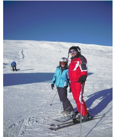
Auf der Blutigen Alm

Gemütlichkeit und familiäre Atmosphäre prägen unser Haus. Gastfreundschaft wird bei uns wörtlich genommen!