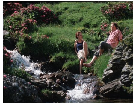
Wanderrast am Gebirgsbach inmitten blühender Almrosen

Gemütlichkeit und familiäre Atmosphäre prägen unser Haus. Gastfreundschaft wird bei uns wörtlich genommen.