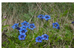
Stängelloser Enzian im Frühling

17.5.12—9.6.12 1 Tag € 56,- 7 Tage € 371,-