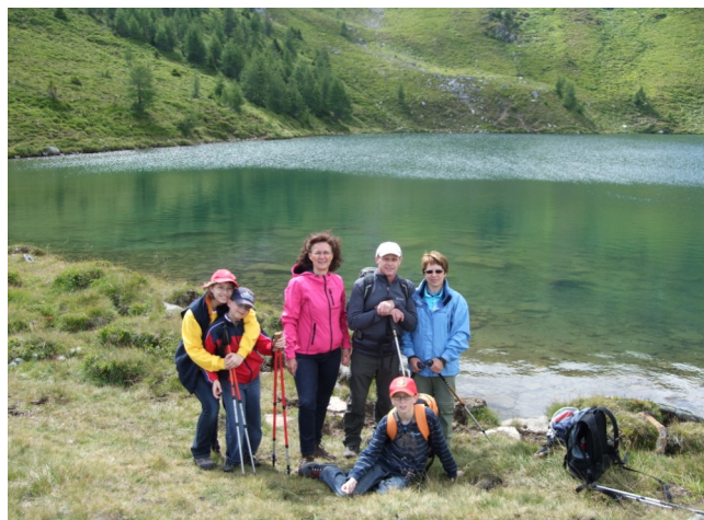
Gemeinsame Wanderung zum Laubnitzsee