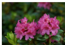
Ein roter Teppich in der Landschaft