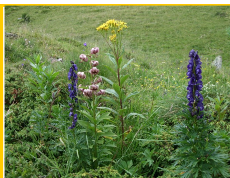
Blumenvielfalt in den Nockbergen