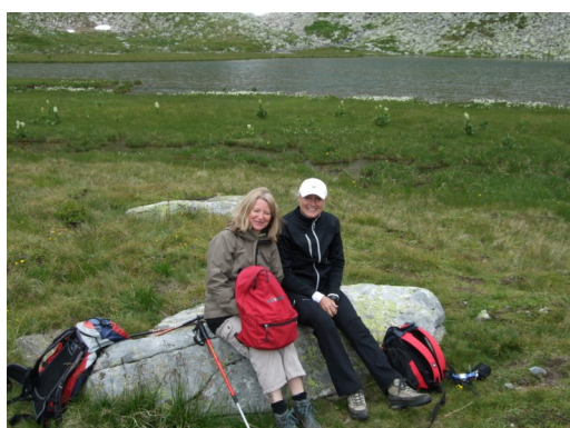
Rast beim Lanischsee-Edelweißwanderung

Unser hauseigener Tennisplatz bietet Ihnen Abwechslung zwischen Ihren Wandertagen