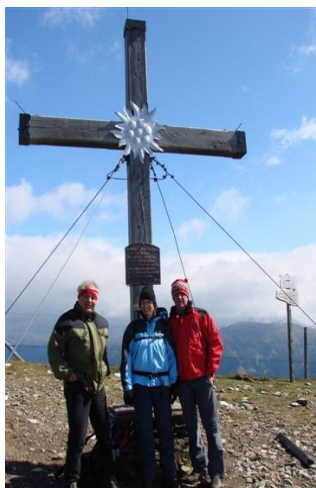
Gipfelwanderung im Spätherbst

Unser Haus hat 30 Gästebetten. Alle Zimmer sind mit Dusche oder Bad, Haarfön, WC, Balkon, Tel, TV ausgestattet. Im geschmackvoll eingerichteten Speisesaal, den rustikalen Gasträumen, im Stüberl oder an der Hotelbar treffen sich unsere Gäste bei Geselligkeit und guter Laune. Wir verwöhnen Sie mit lukullischen Genüssen aus Küche und Keller. Für den Pensionsgast gibt es Wahlmenüs, darunter auch fleischlose Speisen, ein Frühstücksbuffet, eine Salatbar und Dessertwahl.